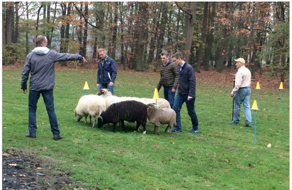
Deelnemers Nd Brug 12 tijdens het schapendrijven.

Op de eerste dag werd er, onder begeleiding van TWST, gestooid met de eigen overtuigingen en effectief interveniëren. In het avondgedeelte stonde de eigen team cases centraal. De tweede dag werden de “ frustraties van werken in teams ” van Lencioni met elkaar besproken en de eigen teams tegen het licht gehouden. De dag werd afgesloten met Sheepman. Opdrachten in het opdrijven van schapen waarin de natuurlijke leiderschap steeds weer opnieuw komt bovendrijven. Frappant is dat deze nogal eens afwijkt van de ideale stijl: een moment voor een goed gesprek.