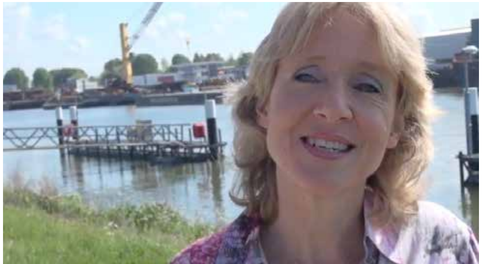
Deelnemer aan de serie 'Kijken in de Spiegel'

De inhoud van Nd Nieuws bestaat grotendeels uit artikelen die ook op de website verschenen. Hiervoor hebben we verschillende artikelen gepubliceerd, zoals verslagen van de Nd Topics en het Nd Webinar . Updates over Lerend Netwerk Duurzaamheid in projecten en de trailer en eerste aflevering van de serie Kijken in de Spiegel . In drie delen, volg je vier deelnemers aan Nd Brug tijdens een intensieve persoonlijke ontdekkingstocht van achttien maanden. De hoofdrolspelers van Kijken in de Spiegel nemen geen blad voor de mond en sparen zichzelf niet. Daarmee geven ze een uniek inkijkje wat deelname aan een leerprogramma als Nd Brug betekent, maar vooral ook brengt. Begin 2018 publiceren we deel 2 en 3.