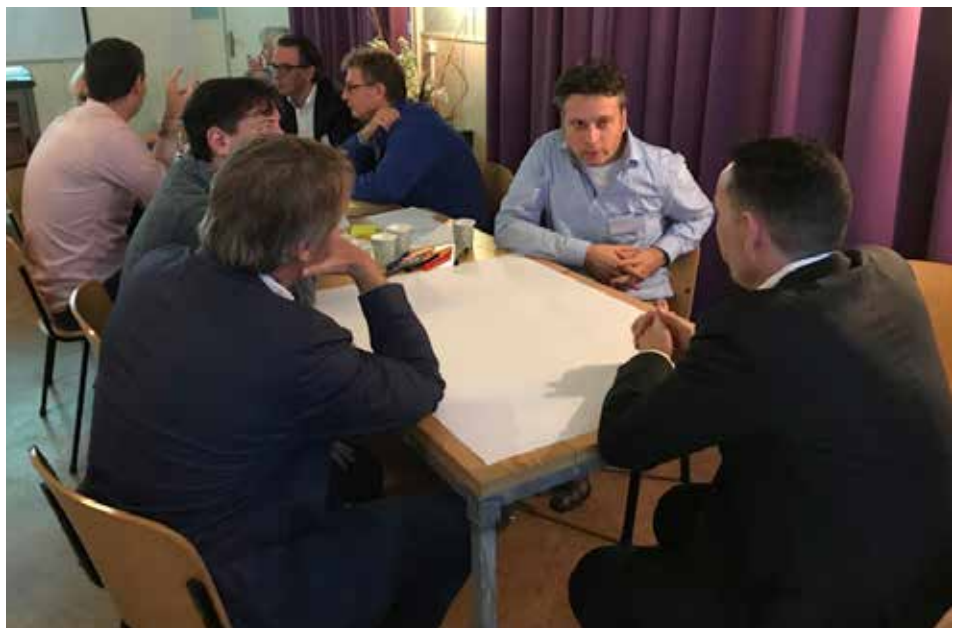
Deelnemers in gesprek tijdens co-creatieve sessie duurzaamheid in projecten