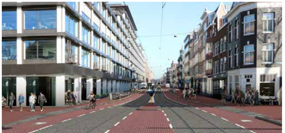
Artist impressie Vijzelstraat.

Neerlands diep organiseerde een projectspiegel voor het Amsterdamse project Vijzelstraat. Dit project is een onderdeel van het project Rode Loper. Een spiegelteam dat bestond uit zeven mensen (verschillende IPM-rollen) van: ProRail, Rijkswaterstaat, gemeente Den Haag, gemeente Rotterdam en Waterschap Rivierenland keek in de keuken bij het project Vijzelstraat. 19 oktober werd de zelfspiegel gemaakt, 31 oktober zijn de dieptegesprekken tussen spiegelteam en projectteam gehouden en werd de collegaspiegel gemaakt. 21 november werd het spiegeltraject afgesloten met een gezamenlijke slot dialoog. De spiegelrapportage is terug te lezen op onze website.